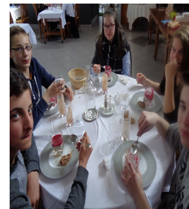
Dégustation au restaurant