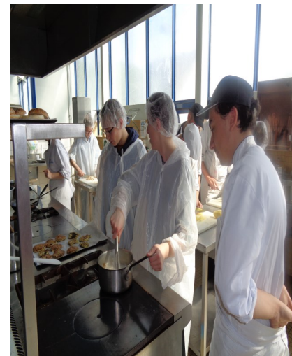
Au fourneau pour les cuissons

C'est pour sensibiliser les collégiens à l'importance de consommer autrement que les lycéens ont accueilli la classe de troisième allemand du collège Notre Dame de la Ferté Macé. Après avoir visionné un diaporama de sensibilisation, sur l'impact écologique, sur la santé et l'équité sociale, les collégiens ont été invités à des ateliers culinaires dans lesquels ils ont préparé un menu végétarien. Samossas aux protéines végétales, galettes de flocons d'avoines aux légumes et tarte vegan au chocolat faisaient partie du menu préparé. Les collégiens ont ensuite dégusté les recettes au restaurant pédagogique. Ils ont beaucoup apprécié ce menu qui était pour eux une véritable découverte. Les lycéens ont au cours de cette séance enseigné des techniques culinaires à leurs invités, ils ont aussi échangé sur le métier de cuisinier et sur l'importance du bien manger pour la santé. Cette journée restera gravée dans la mémoire des collégiens qui pourront faire des liens avec les EPI travaillés dans leur établissement.