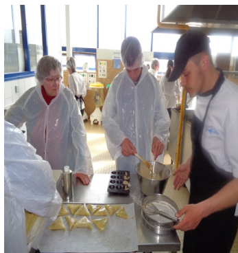
Préparation des samossas