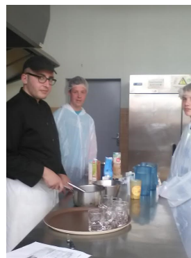
Mis en œuvre des desserts