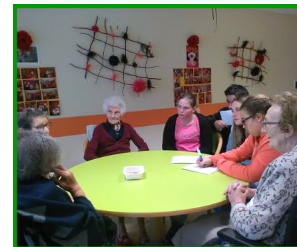
Les lycéens se laissent porter par l'histoire