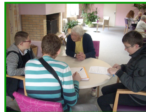
Chacun se présente

Les lycéens sont allés rencontrer les résidents des Ehpad avec de nombreuses questions. Ils souhaitent en effet, découvrir comment leurs aînés se nourrissaient lorsqu'ils avaient leur âge. Aussi, le temps d'un après-midi, les résidents sont allés puiser dans leurs souvenirs permettant aux élèves de voyager au cœur de leur l'histoire. Les conditions de vie d'avant, pendant et après la guerre ont refait surface. « Les repas étaient préparés avec les légumes du jardin et souvent avec de la volaille » « On avait pas de frigo pour conserver » « Pendant la guerre, on avait des tickets de rationnement, les rations étaient faibles alors il n'était pas question de gaspiller » « On n' avait pas de plats préparés mais il n'y avait pas de pesticides... » Pendant près de 2 heures jeunes et anciens ont échangé sur les différences alimentaires et sur les conditions de vie d'hier et d'aujourd'hui. Les lycéens sont repartis très riches de ces échanges. Ils vont s'appuyer sur ces données pour travailler autour du développement durable et de l'histoire. Ils partageront leur travail sur Etwinning avec leurs partenaires Polonais, Allemands et Italiens qui travaillent sur le même projet dans leur pays. Aussi, ils pourront comparer les différences alimentaires des pays Européens.