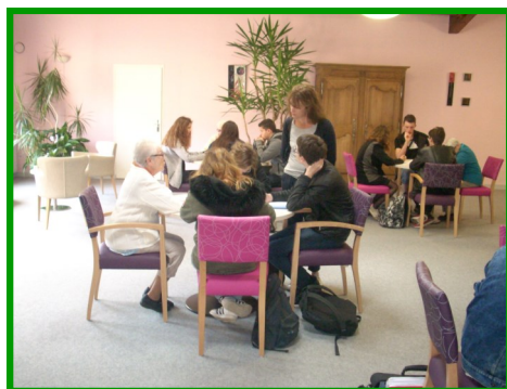
Les séniors se remémorent leur passé

7/9 avenue le Meunier de la Raillère BP 109 61600 LA FERTE MACE