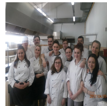
Partenaires Français et Norvégiens