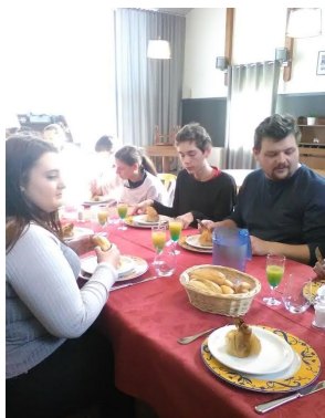
Dégustation des plats Franco-Norvégiens