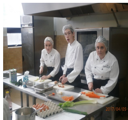
Mis en œuvre des techniques culinaires