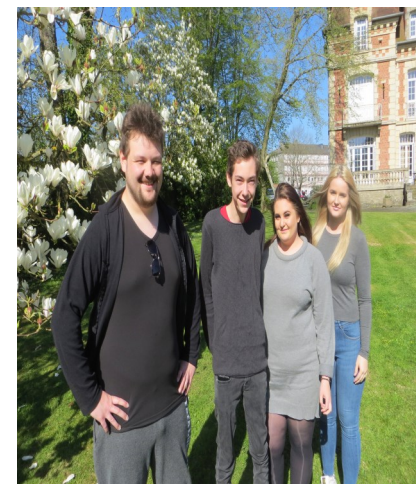
Les élèves Norvégiens

Ce sont 4 étudiants de Austrheim VGS près de Bergen en Norvège qui ont découvert la Normandie pendant 2 semaines au lycée professionnel Flora Tristan. Pendant leur séjour, ils ont découvert le système éducatif français. Ils ont ainsi avec leurs camarades participé à des séances d'enseignement théoriques et pratiques. Les partenaires ont échangé leurs spécialités et leurs astuces culinaires. Les plats typiques français font désormais partie de la culture culinaire des élèves Norvégiens. Les lycéens Fertois ont également enrichi leur répertoire grâce à la soupe de poissons typique de la région de Bergen qu'ils ont cuisiné et dégusté ensemble. Des sorties culturelles étaient également au programme, visite du Mont Saint Michel, Honfleur, Deauville mais aussi le lactopôle de Laval. Les futurs restaurateurs Norvégiens ont pu déguster les produits locaux tels que les fromages, le cidre, l'andouille de vienne.... Logés à l'internat la semaine, ils ont été accueillis dans des familles le week-end. Tous les élèves ont apprécié cet échange et ont beaucoup communiqué en anglais. Ces partenariats permettent d'enrichir leurs connaissances culinaires, linguistiques et culturelles et seront un atout pour leur insertion professionnelle.