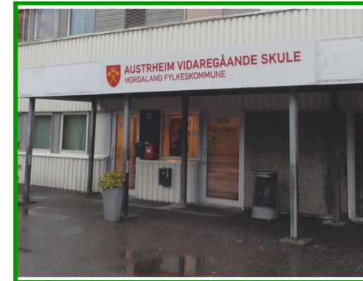
Le Lycée Professionnel partenaire

La ville de Bergen, nichée au creux d'un fjord, avec le quartier de Bryggen à l'architecture unique.