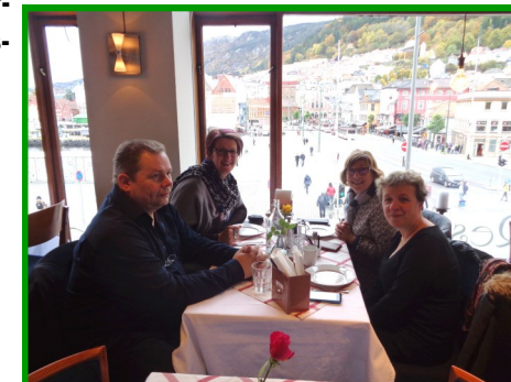
Déjeuner de travail dans un bien joli décor