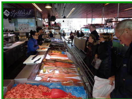
Le marché aux poissons de Bergen

7/9 avenue le Meunier de la Raillière BP 109 61600 LA FERTE MACE